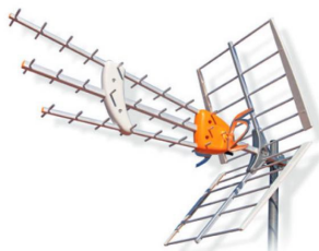
Antena UHF HD BOSS A11495