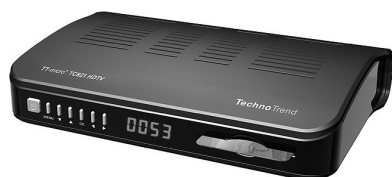
STB Kathrein TechnoTrend TT-micro TC821