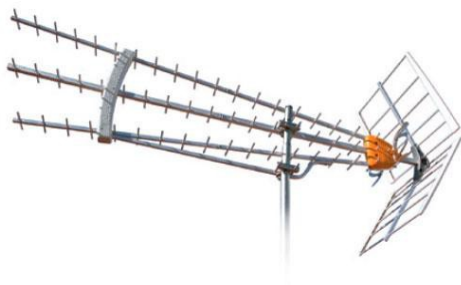
Antena UHF HD BOSS A11497

-Za prijem u zoni 3 (slab signal na granici prijema)