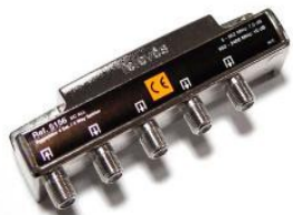
Spliter. Razdelnik 1/4 P5156IC