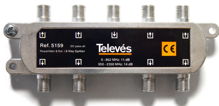
Spliter. Razdelnik 1/8 P5159IC