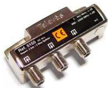
Spliter. Razdelnik 1/2 P5155IC