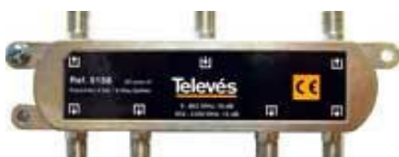
Spliter. Razdelnik 1/6 P5158IC